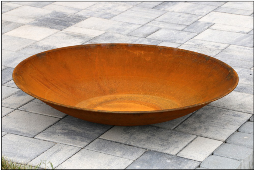
Ohniště / pítko pro ptáky

Odpadkový koš z akátu o rozměrech cca 450 x 450 x 750 mm (d,š,v) bude vyroben z akátových řezaných prken, která budou ukotvena na dřevěný rám. Rám budou tvořit akátové hranoly. Dřevo bude ošetřeno olejovou nátěrovou hmotou s UV filtrem pro zvýšenou odolnost a jednotnou estetičnost. Uvnitř koše bude uložena pozinkovaná vložka. Koš bude usazen volně na povrch.